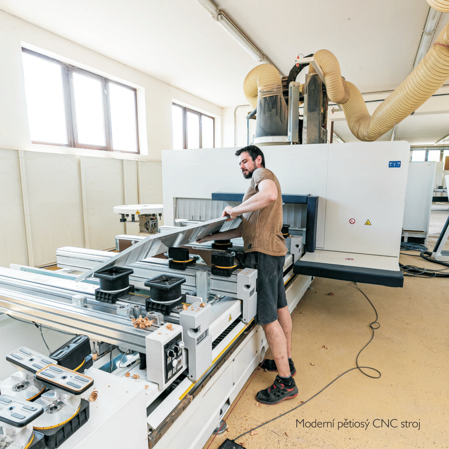
Moderní pětiosý CNC stroj